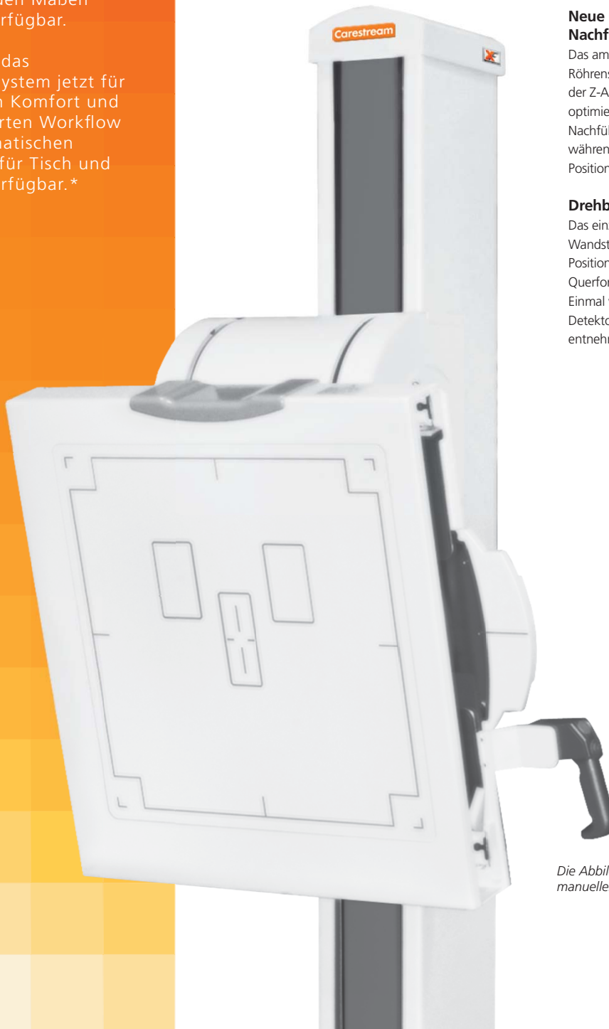
Die Abbildung zeigt das Bodenstativ mit der Option zum manuellen Kippen des Buckys.

*Nicht für den kommerziellen Verkauf verfügbar